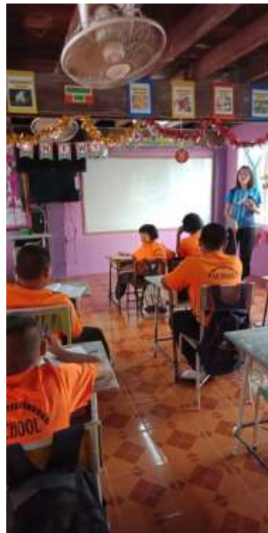
กิจกรรมการจัดการเรียนการสอนระบบ DLTV