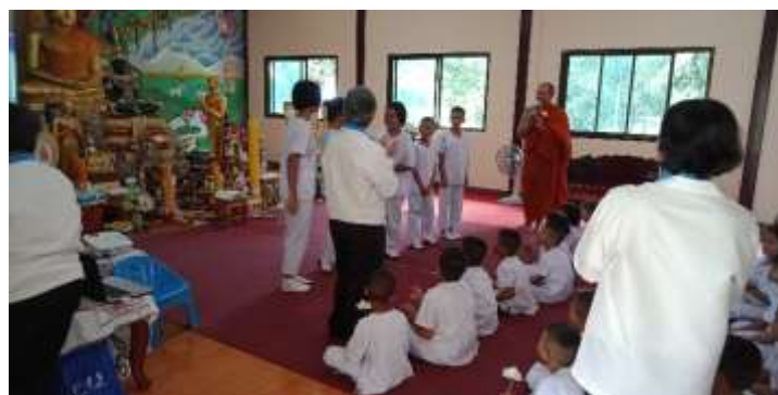
อบรมคุณธรรมจริยธรรมวัดไพรงาม