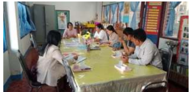
ประชุมคณะกรรมการสถานศึกษา