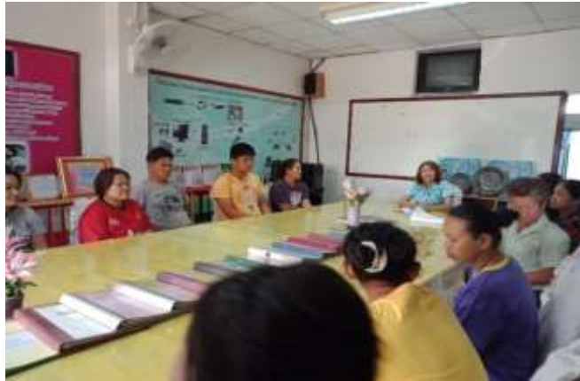
ประชุมผู้ปกครองนักเรียน