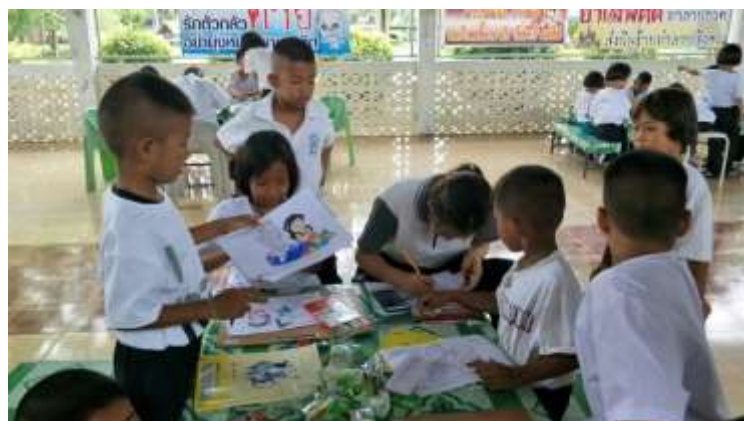
กิจกรรมรณรงค์ด้านยาเสพติด