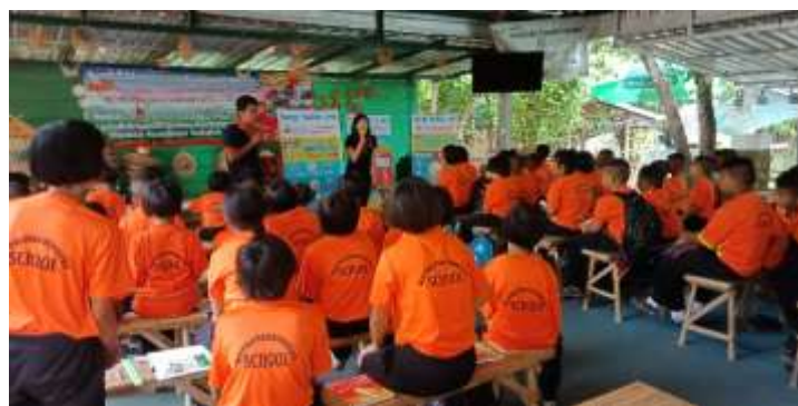
ศึกษาแหล่งเรียนรู้ศูนย์การเรียนรู้เศรษฐกิจพอเพียง