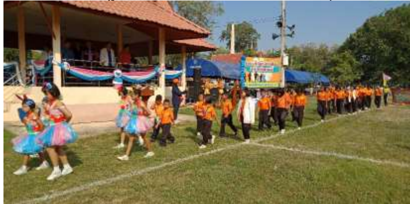
ร่วมกิจกรรมการแข่งขันกีฬากลุ่มเครือข่าย