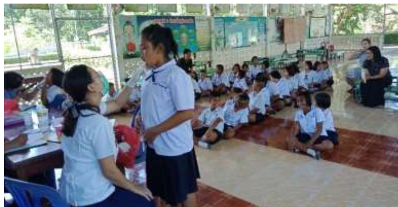
สาธารณสุขดูแลสุขภาพปากและฟันนักเรียน