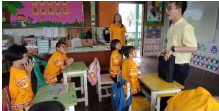
นิเทศชั้นเรียน ป.1 ของศึกษานิเทศก์สำนักงานเขต