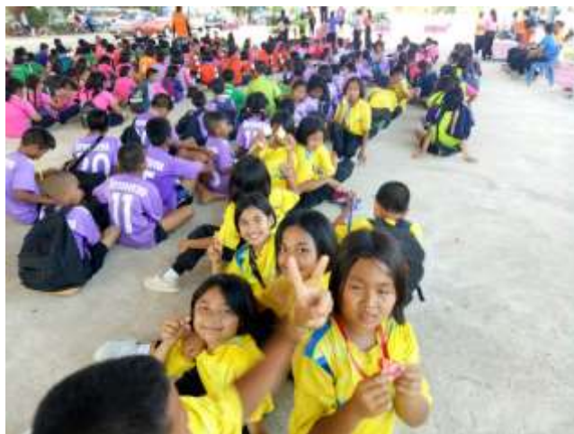
ประชุมคณะกรรมการสถานศึกษา