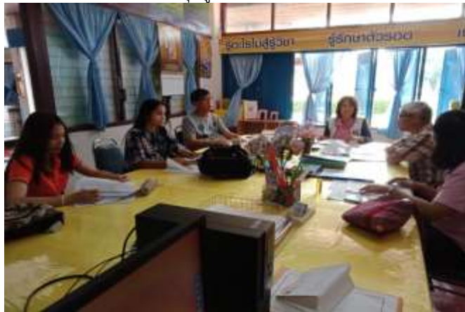
ประชุมครูและบุคลากร